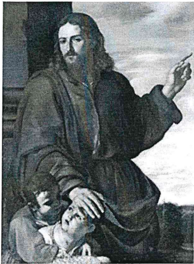
Artemisia Gentileschi, Sinite parvulos , Roma, Chiesa di San Carlo al Corso, olio su tela, 132 x 92 cm.

Presentazione del restauro del dipinto Sinite Parvulos di Artemisia Gentileschi, proveniente dalla Chiesa di San Carlo al Corso