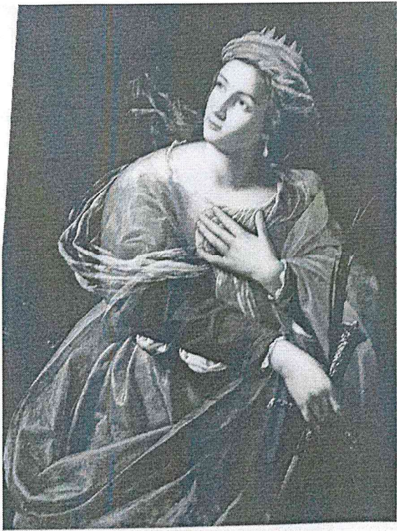
Artemisia Gentileschi, Santa Caterina, olio su tela, cm. 99 x 73, collezione privata