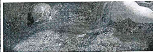
Artemisia Gentileschi, Danae, olio su tela, cm. 40 x 60 circa, senza cornice, collezione privata, firmata