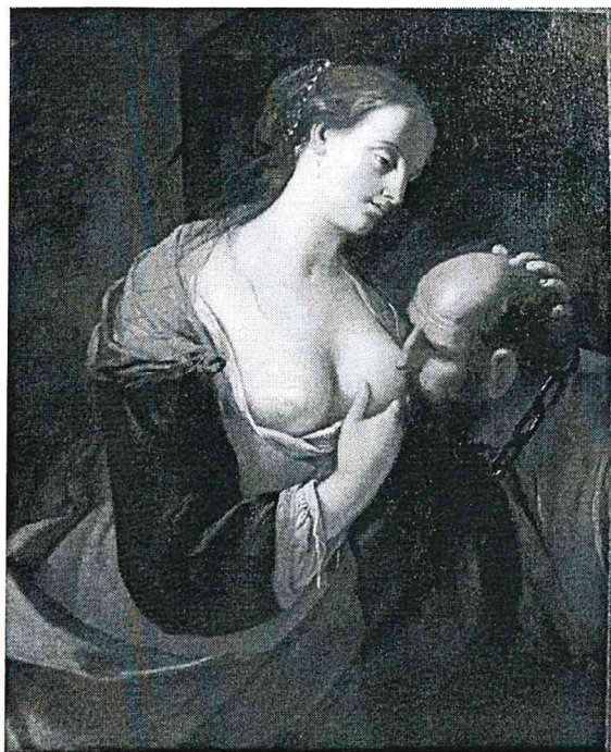
Mattia Preti, Charitas Romana, olio su tela, cm. 116 x 91

Saranno esposte alcune opere d'arte, legate al tema materno e della generosità delle donne: