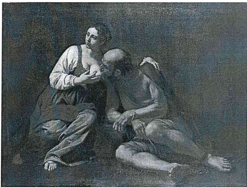
Ambito Manfrediano Charitas romana, olio su tela, cm. 150 x 200