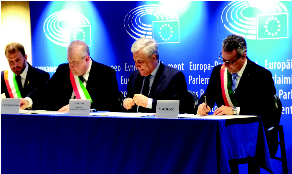
La firma del Patto di Gemellaggio tra le città di Norcia, Subiaco e Cassino all'aprensza del Presidente del Parlamanto Europeo Antonio tajani (marzo 2017)